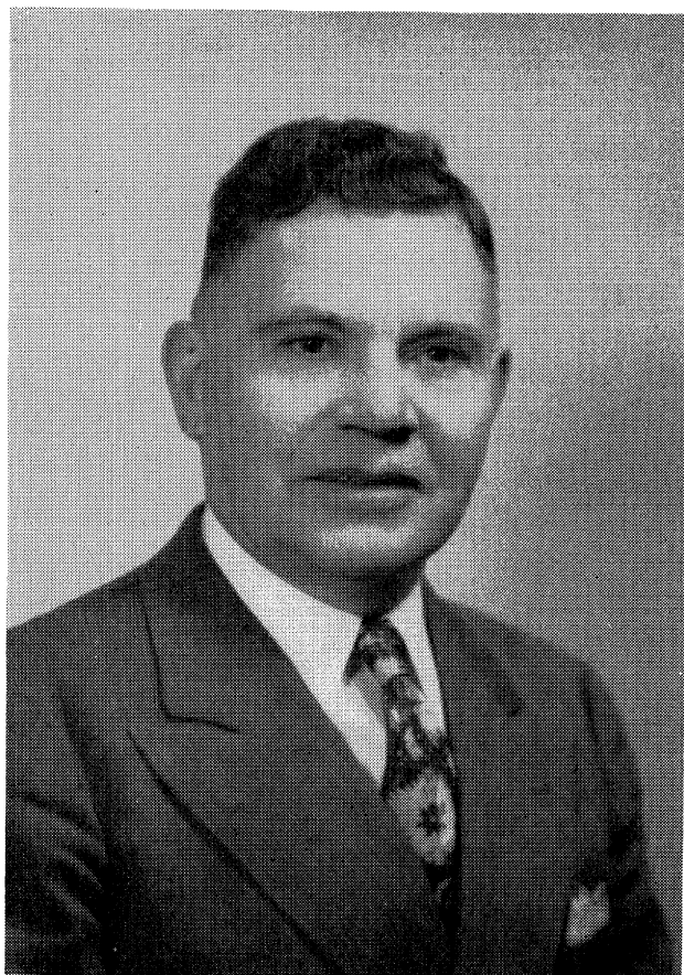
דער מחבר פאָטאָגראַפֿירט אין יאָר 1951